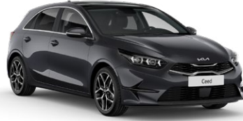
Fırtına Gri (H8G)