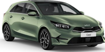
Experience Yeşil (EXG)