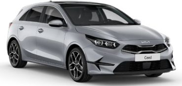
Gümüş Gri (KCS)