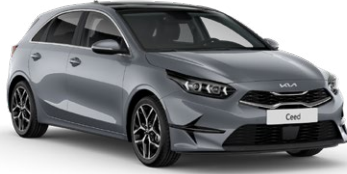
Aytaşı Gri (CSS)