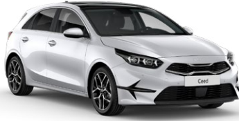
İnci Beyaz (HW2)