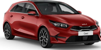
Manyetik Kırmızı (AA9)