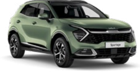
Experience Yeşil (EXG)