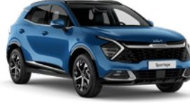
Gökyüzü Mavi (B3L)