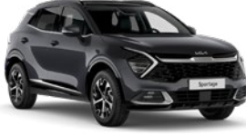
Fırtına Gri (H8G)