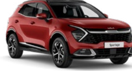
Manyetik Kırmızı (AA9)