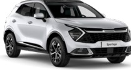
İnci Beyaz (HW2)