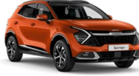
Fusion Turuncu (RNG)