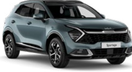
Yuka Gri (USG)