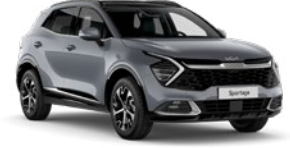
Aytaşı Gri (CSS)